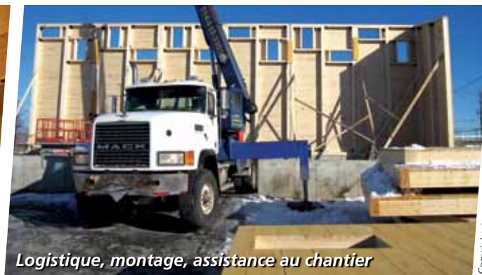
Logistique, montage, assistance au chantier

Copyright © 2009 Architectures Toubois (2007) inc. Architectures Toubois est une filiale de Metaltech-Omega inc.