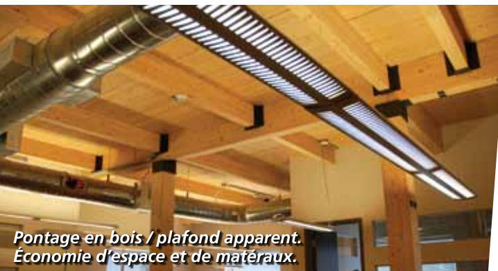
Pontage en bois / plafond apparent. Économie d'espace et de matériaux.